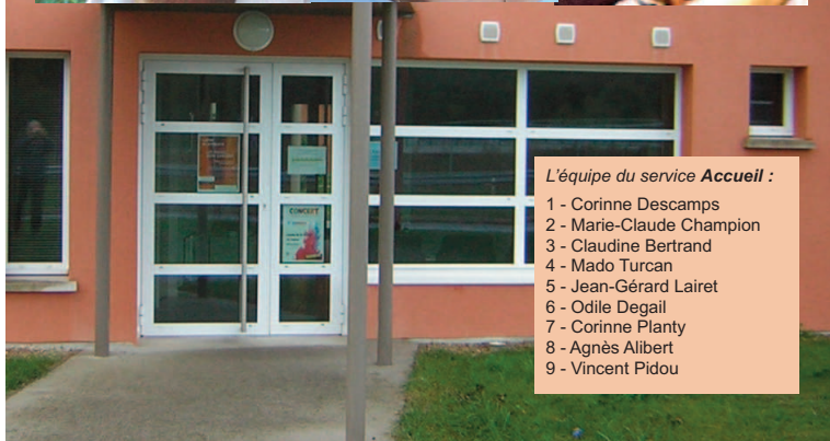
L'équipe du service Accueil :