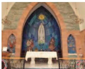
Eglise N-D de Fatima à Damas

Le christianisme est né en Orient, au moment où, selon les Pères de l'Église, « le monde pouvait le recevoir ». La mosaïque des communautés dans lesquelles se répartissent aujourd'hui les chrétiens du Proche-Orient résulte de leur ancienneté, des conditions de leur fon-