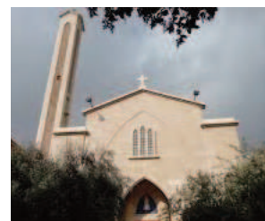
Eglise N-D de Fatima à Damas